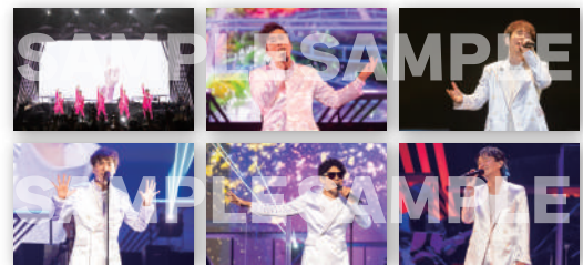
ゴスペラーズ坂ツアー 2025 “G30” チャリティーポストカードセット (6 枚組) ¥1,000 【税込】