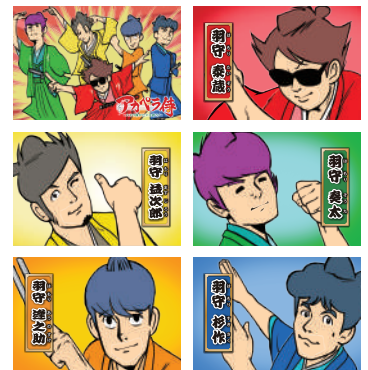
“GOSMANIA ファンの集い 2023” アカペラ特 チャリティーポストカードセット (6 枚組) ¥1,000 【税込】