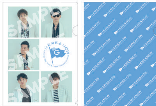
ゴスペラーズ坂ツアー 2023 “HERE & NOW” チャリティークリアファイルセット (A4 サイズ 2 枚組) ¥1,000 【税込】